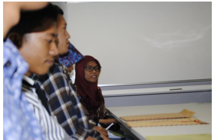
Salah seorang mahasiswi sedang mengajukan pertanyaan