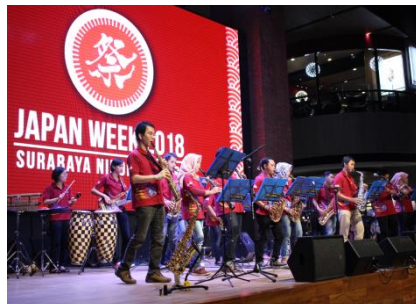
「YAMAHA East Wind Orchestra」による演奏パフォーマンス