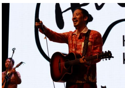
歌手 加藤ひろあきさんによるパフォーマンス