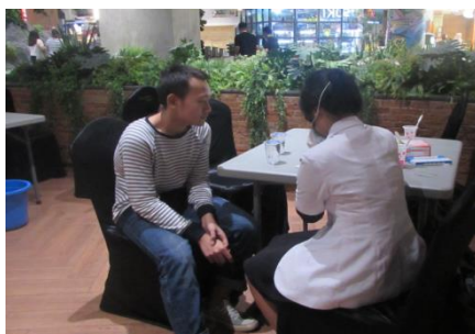
元日本留学生協会による日本式無料歯科検診