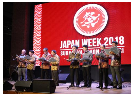
「ラグラグ会」による歌唱パフォーマンス