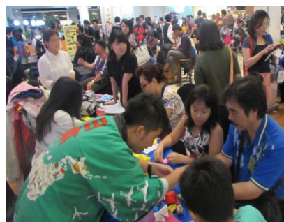
国際交流基金派遣日本語パートナーズによる文化紹介ブース