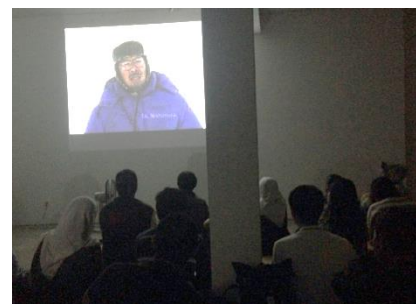
別会場（C20 Library&Collabative）での映画上映会