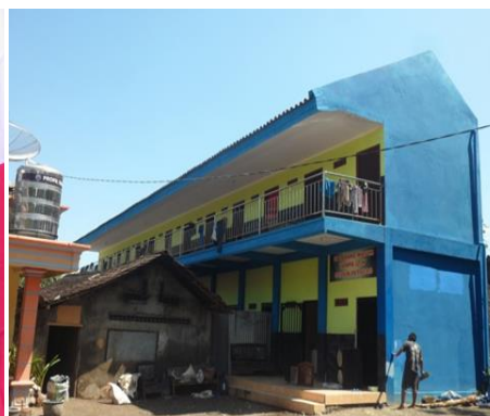
建設された新病棟