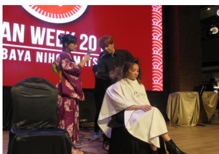
「NOBU」日本人スタイリストによるヘアアレンジ ワークショップ