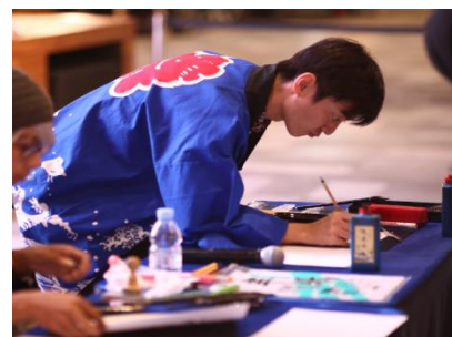
書道パフォーマンス・ワークショップ