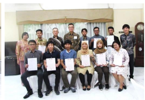
Foto bersama para undangan