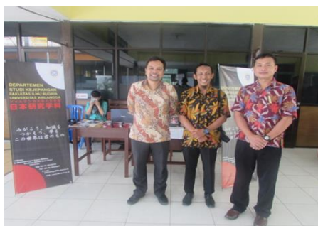
Booth Prodi Sastra Jepang Universitas Airlangga

Pada acara penutupan Konsul Muda Keigo Kashiwabara memberikan kata sambutan yang menyemangati para pembelajar bahasa Jepang di Kaltim dan dengan berpijak pada tahun ini yang merupakan peringatan 60 tahun hubungan diplomatik Jepang-Indonesia, para peserta sekalian diharapkan di masa mendatang dapat berperan menjadi jembatan penghubung Jepang-Indonesia yang berkontribusi bagi perkembangan hubungan persahabatan kedua Negara. Kemudian beliau menutup acara ini dengan menyerahkan piagam penghargaan serta hadiah kepada masing-masing pemenang lomba.