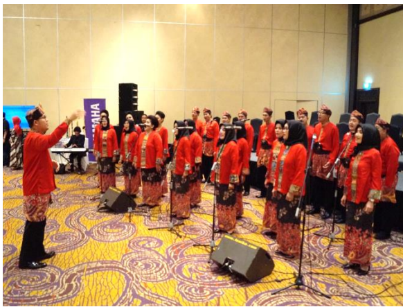
Penampilan oleh Swara Svarna Indonesia