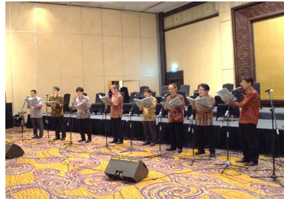
Penampilan oleh Lagu-lagu Kai