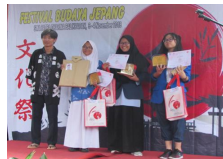
Suasana penyerahan hadiah kepada juara