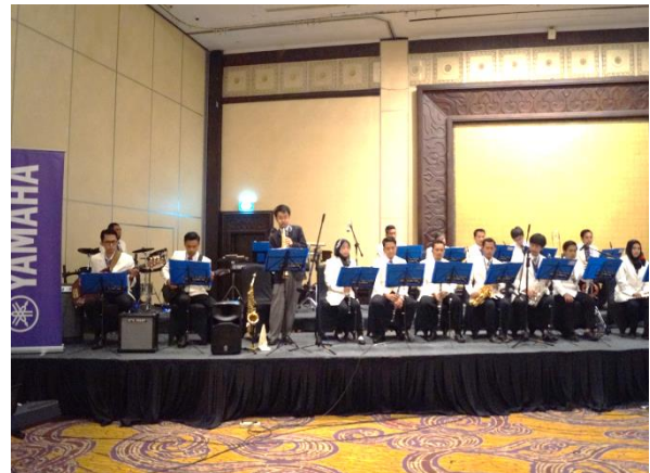
Penampilan oleh YAMAHA East Wind Orchestra