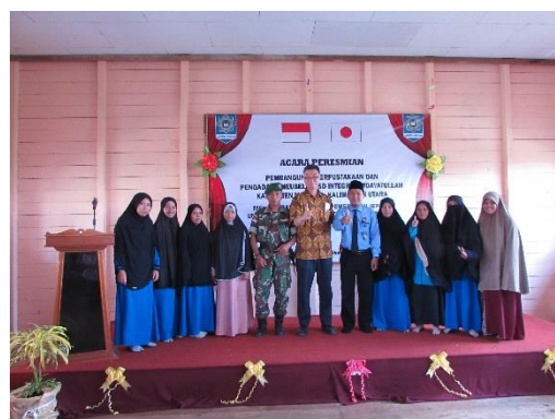
「マリナウ県イスラム小学校における図書室建設及び教室備品整備計画」完成式典