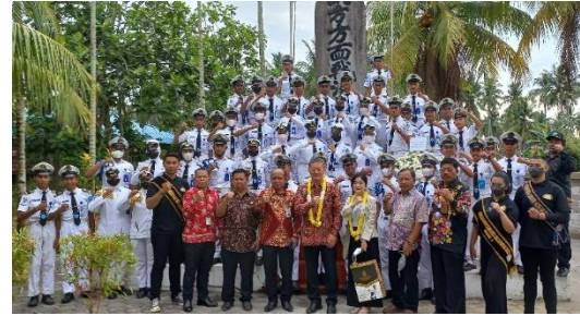
南方方面戦没者慰霊碑