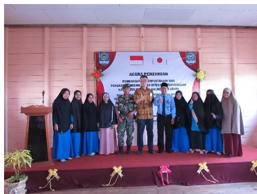
「マリナウ県イスラム小学校における図書室建設及び 教室備品整備計画」完成式典